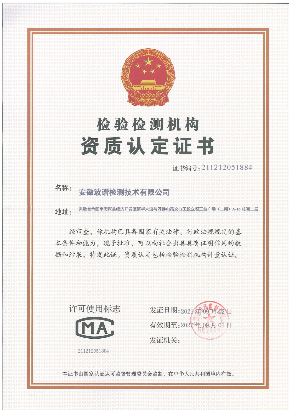
图 8.3-1 检测机构资质认定证书