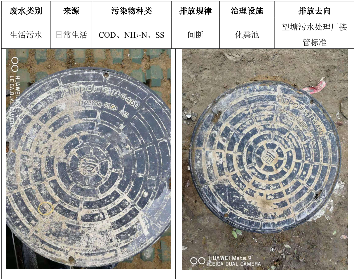
图 4.1-1 项目污水排放口及雨水排放口