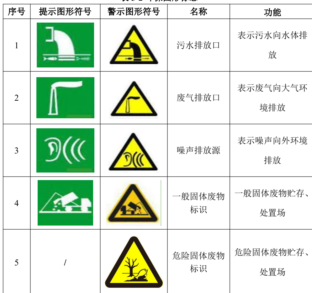
表 5-2 环保图形标志

本次技改项目依托现有危废暂存间，现有工程危废暂存间采取防扬散，防流失，防渗漏等防治措施，不对环境造成二次污染，并设置醒目的标志牌。